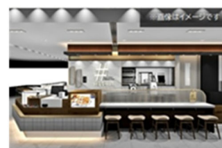
※画像は店舗イメージです

【HASHLE Instagram】 https://www.instagram.com/hashle_waffle/