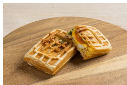
エッグベネディクト