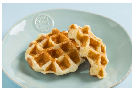
マカダミア&ホワイトチョコ

北海道産発酵バターを練り込んだ生地にホワイトチョコチップを包みマカダミアナッツをのせて焼き上げたリエージュワッフル『マカダミア&ホワイトチョコ』、包餡タイプの生地に甘酸っぱいフランボワーズのクリームと果肉、レアチーズクリームを包み焼き上げたハッシュルワッフル『フランボワーズ』、包餡タイプの生地に半熟卵、ベーコンなどをあわせオランダーズソースでアクセントをつけたハッシュルワッフル『エッグベネディクト』の3種類です。商品詳細は次ページをご参照ください。