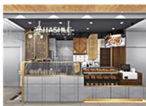
※画像は店舗イメージです